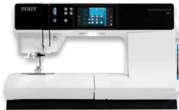
Uitzonderlijk veel ruimte voor grote hoeveelheden stof.

Met één druk op een toets hecht de machine af, wordt de naaivoet automatisch omlaag of omhoog gebracht, worden de boven- en onderdraad afgesneden, wordt de transporteur omlaag gebracht ... wanneer u dat wilt.