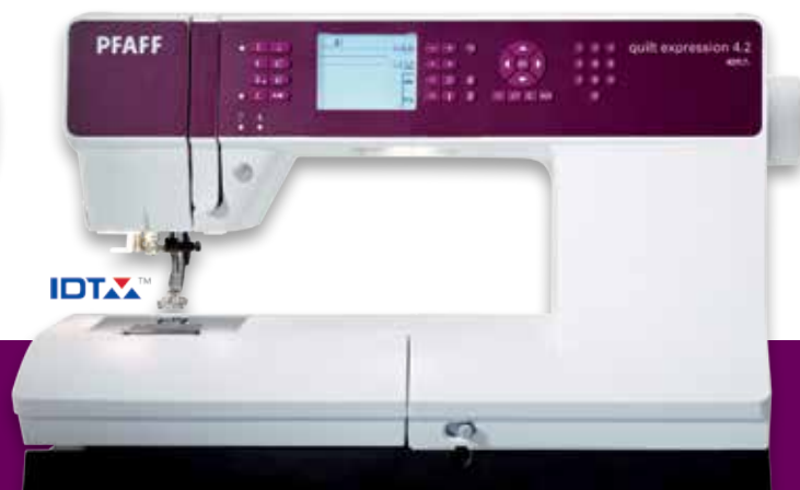
quilt expression™ 4.2