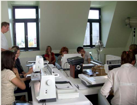
The Next Fashion Talent Episode 3 Pfaff-Schulung + Fashion-Zeitreise, Berlin