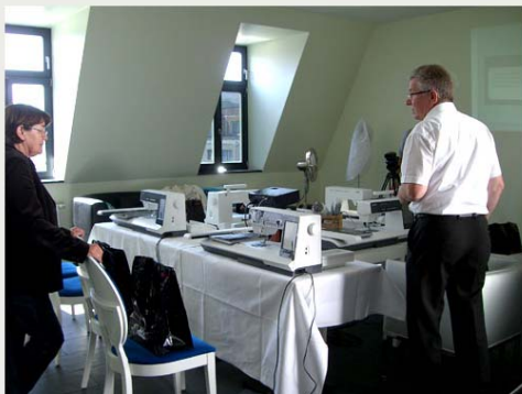
The Next Fashion Talent Episode 3 Pfaff-Schulung + Fashion-Zeitreise, Berlin