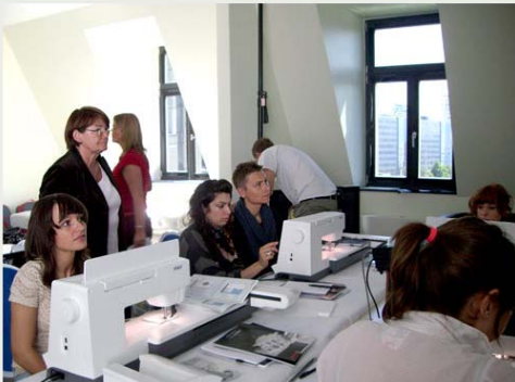
The Next Fashion Talent Episode 3 Pfaff-Schulung + Fashion-Zeitreise, Berlin