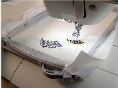
The Next Fashion Talent Episode 3 Pfaff-Schulung + Fashion-Zeitreise, Berlin