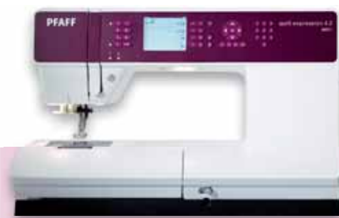
quilt expression™ 4.2